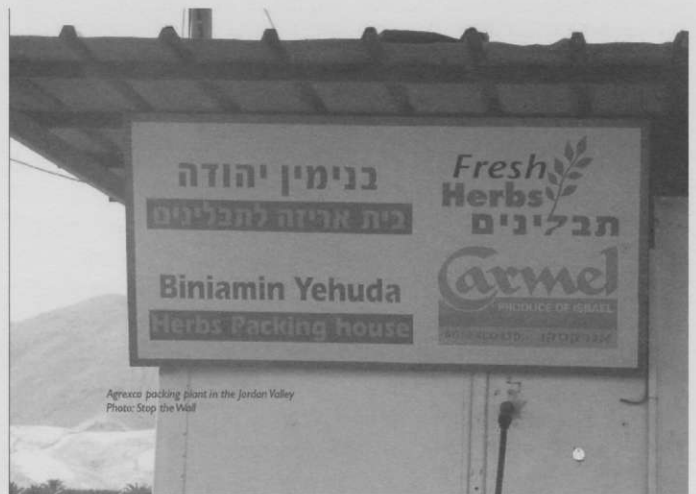
Verpackungshalle von Carmel/Agrexco im Jordantal

Bereits zum dritten Mal haben AktivistInnen der britischen BDS-Kampagne die Verteilzentrale von Carmel/Agrexco in England blockiert. Zudem haben sie am Valentinstag zum Boykott israelischer Blumen aufgerufen, die Agrexco exportiert. Die Firma gehört zur Hälfte dem israelischen Staat. Carmel/Agrexco ist auch der grösste Exporteur von Produkten aus den besetzten Gebieten. Die Firma vermischt bewusst Siedlungsprodukte mit Produkten aus Israel, sodass ihr Ursprung nicht verfolgt werden kann, und deklariert Produkte aus den besetzten Gebieten als „Made in Israel“. Sie können damit auf Grund der EU- und EFTA-Freihandelsabkommen in Europa zollfrei eingeführt werden.