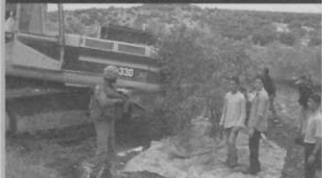
Plakate der Anti-Caterpillar-Kampagne